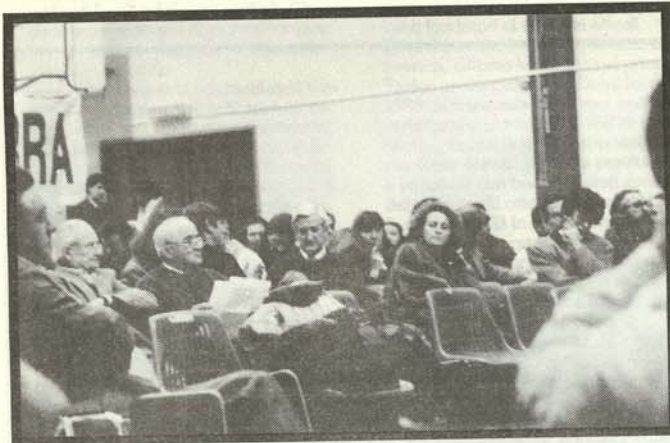
I DATI DEL XVIII CONGRESSO PROVINCIALE DEL PCI